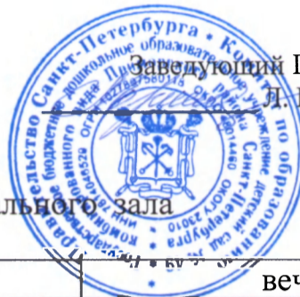
График проветривания музыкального зала